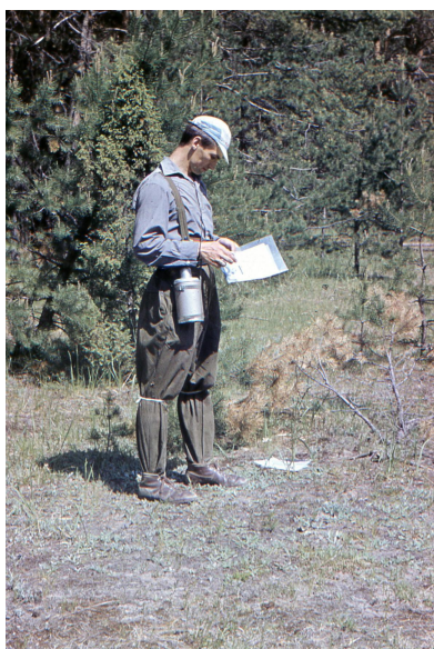
Фото 5: Подготовка карты и постановка дистанций. Северная зона РСФСР, 1971г.